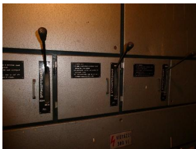
5. kép: A lépcsőházankénti tűzeseti főkapcsoló