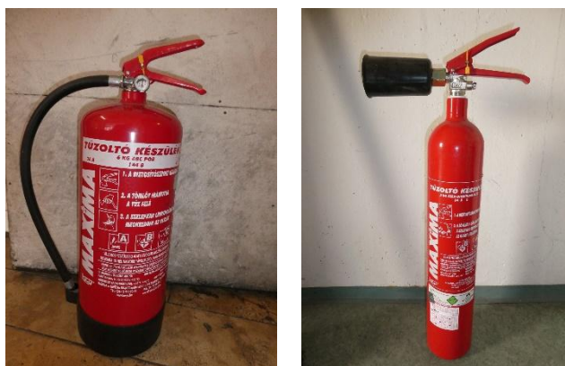
3. kép: Hordozható tűzoltó készülékek különböző típusai