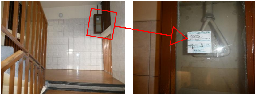
2. kép: Hő- és füstelvezetést, menekülést biztosító távnyitó