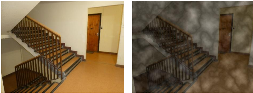
1. kép: Menekülési útvonal, a keletkező füst látást korlátozó hatása